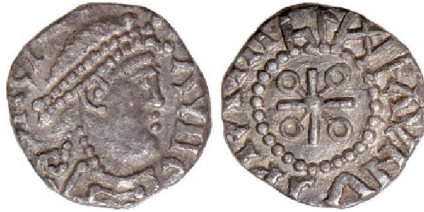
Fig. 3 – Pada type III, ca. 675-685, gevonden in Thanet (schaal 250%)

den geslagen. [37] Ook valt de preprimaire fase met de zgn. Pada-types te beschouwen als een onmiddellijke verderzetting van munten in bleek goud. [38] Het beste voorbeeld hiervan zijn de munten van het type Pada III (Fig. 3) die zowel in zilver als bleek goud bestaan. Waarschijnlijk hadden de zilveren munten dezelfde waarde als de gouden variant, althans binnen het beoogde gebruik. [39]