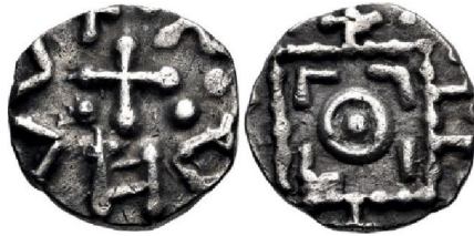
Fig. 1 – Serie D, type 8, ca. 690-715/720, geslagen in Noord-Friesland (schaal 250%)

Net zoals bij de primaire sceatta's, was het circulatiegebied van deze sceatta's eerder beperkt tot de kust en de belangrijke rivieren. [21]