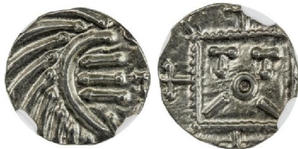
Fig. 2 – Serie E, ca. 695-740, waarschijnlijk geslagen in het Nederlandse Grote-Rivierengebied (schaal 250%)

https://www.coinarchives.com/w/lotviewer.php?LotID=3594032&AucID=3662&Lot=497&Val=c7cb3ccf81365159183eb862aace639d (geraadpleegd op 4 april 2018)