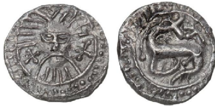
Fig. 4 – Serie X, ca. 720-755, waarschijnlijk geslagen in Ribe (schaal 250%). Met dank aan Bruun Rasmussen. Numisbids . 2018. Bruun Rasmussen Auction 881, lot 1 (1,01 g). https://www.numisbids.com/n.php?p=lot&sid=2847&lot=1 (geraadpleegd op 4 november 2018)

In Ribe komen slechts twee types voor, nl. het Wodan/monster-type (Fig. 4) en het stekelvarken-type (slechts 4 of 5). Het gaat hier in beide gevallen om Friese types, geslagen tussen 725 tot het midden van de 8 ste eeuw, maar die waarschijnlijk tot 800 hebben gecirculeerd. [179] Bij de meer dan 200 aangetroffen munten gaat het in meer dan 85% van de gevallen om het Wodan/monster-type, waardoor het mogelijk is dat deze munten in Ribe zelf zijn geslagen. [180] Deze munten werden ook in de workshops zelf aangetroffen. [181]